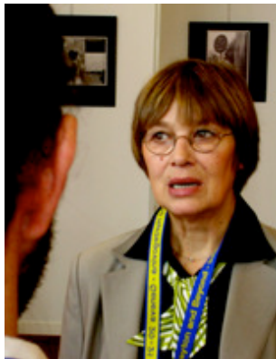
Natasa Kandic (Ginevra)

Alla Conferenza internazionale di Ginevra gli inviati di Osservatorio sui Balcani hanno incontrato Nataša Kandić, direttrice del Centro per il diritto umanitario di Belgrado, con la quale hanno discusso della attuale situazione in Serbia, del confronto col passato, dei crimini di guerra e del Tribunale dell'Aia