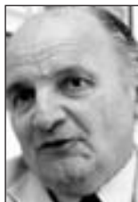
Finci: Početak „briselke ere“

Dejtonska BiH kakvu smo imali proteklih deset godina, prema riječima predsjednika te aso-