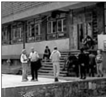
Zatvor u Foči: Mekteb postoji već pet mjeseci

- Tačno je da se ova eksplozija poklapa sa klanjanjem prvog bajram-namaza u KPZ, ali ja mislim da to nema veze s tim. Objekat